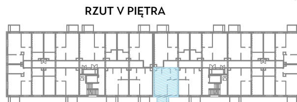
RZUT V PIĘTRA