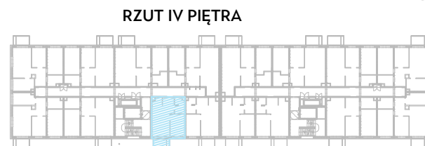
RZUT IV PIĘTRA