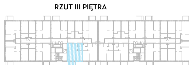
RZUT III PIĘTRA