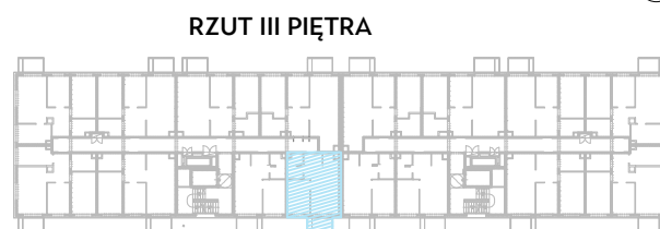
RZUT III PIĘTRA